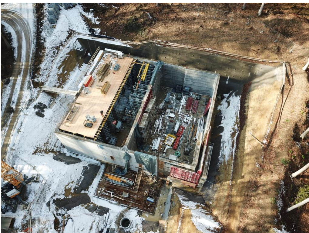
Einbau der Deckenschalung